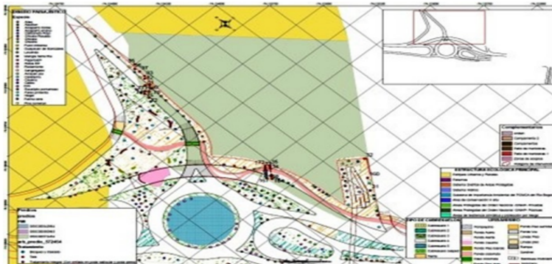
Gráfica 1: Vista general de la ubicación del intercambiador vial en la intersección de la avenida Medellín (calle 80) con avenida las quintas (CARRERA 119) y la carrera 120 en Bogotá D.C. Fuente: Radicado 2025ER264336 6/11/2025

En el predio privado ubicado en la Carrera 119 No 80-53, en la localidad de Engativá de la ciudad de Bogotá D.C. para la ejecución del Contrato IDU-636- 2024, que tiene por objeto "ELABORACIÓN DE LOS ESTUDIOS, DISEÑOS Y CONSTRUCCIÓN DEL INTERCAMBIADOR VIAL EN LA INTERSECCIÓN DE LA AVENIDA MEDELLÍN (CALLE 80) CON AVENIDA LAS QUINTAS (CARRERA 119) Y LA CARRERA 120 EN BOGOTÁ D.C."